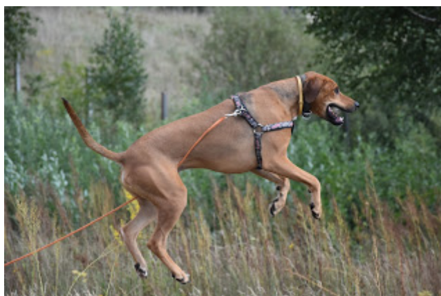
Bruno, przydomek Bruneschi-Wielki Destruktor albo Myśliciel/Kierkegaard zrobi wszystko dla piłeczki