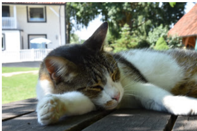
Ten Lili kot transgenderowy