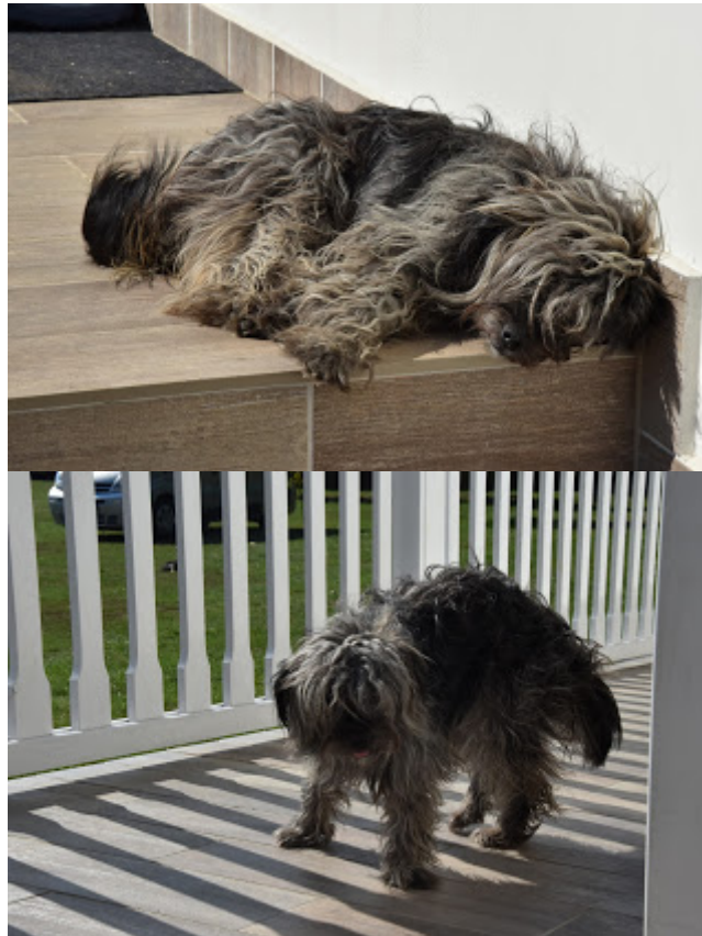
Kosma primo voto Kocmoł vel Chewbacca