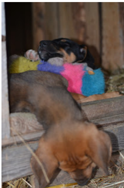
czerwiec 2013 r.